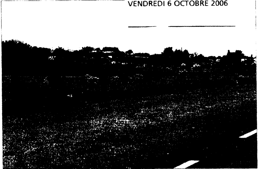
Les marais salants de Saint-Hilaire-de-Riez bordent la zone industrielle du Gâtineau dont l'agrandissement est prévu avec une ZAC à usage commercial.