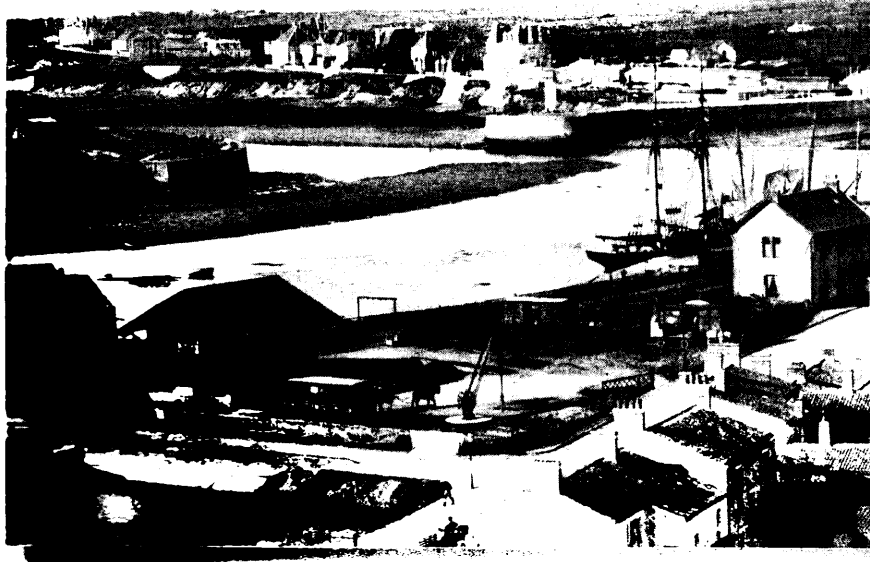
Vue de la côte de Croix de Vie depuis le port (Archives Municipales de St Gilles)