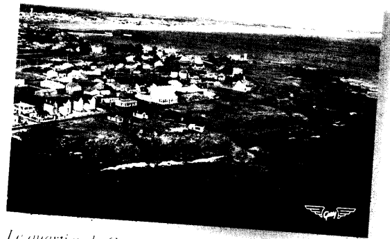
Le quartier de Grosse Terre dans les années 1950

Les municipalités sont conscientes du formidable potentiel que peut représenter le tourisme. Dès 1882, un conseiller municipal de Croix-de-Vie désire rendre plus agréable le séjour des touristes. Il propose d'aider financièrement le comité qui s'est formé pour organiser des fêtes, des régates, des courses et autres jeux publics. Contrairement à ce que l'on croit trop souvent, les municipalités ne sont pas philanthropes. En 1907, le conseil municipal de Croix-de-Vie, soucieux que les Domaines n'aliènent pas des terrains proches de la plage de Boisvinet, s'insurge contre ce coup d'arrêt à la croissance :